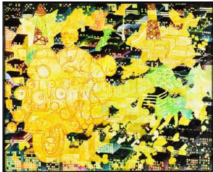
《さようなら さようなら》