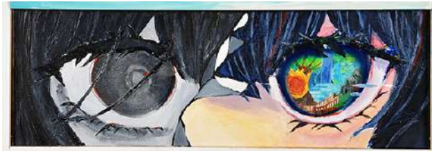
げんじつとうひ 《現実逃避》