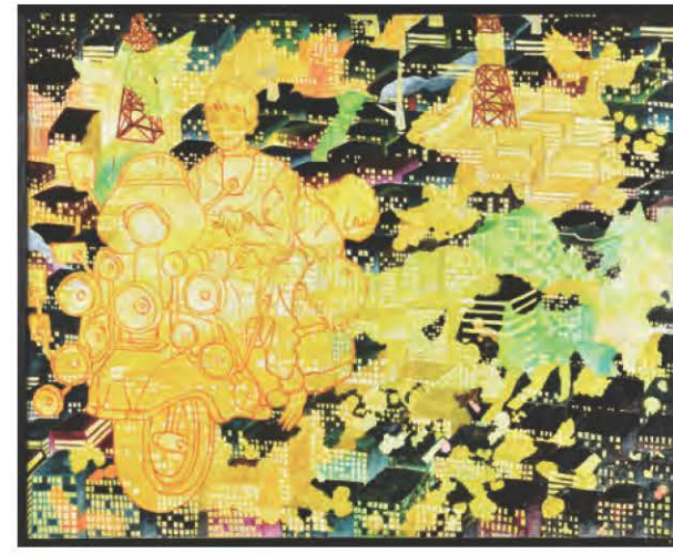
最優秀賞 平面作品 《さようなら さようなら》 横山 陸彦