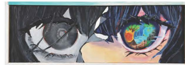
コミュゼ川崎大賞 平面作品 《現実逃避》 山本 叶音